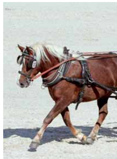
Mit 8,68 Beste der Prüfung in Marbach: