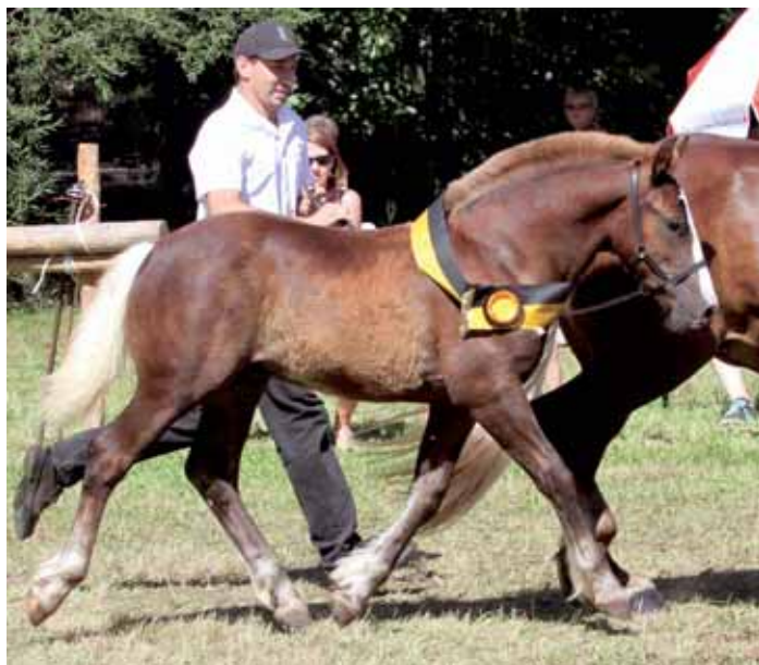
Sieger in Kohlenbach: das Hengstfohlen von Maitanz/Dachsberg