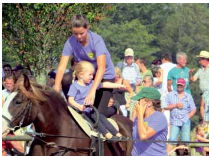
Auch die Kleinen dürfen beim Rossfest ihr Können zeigen