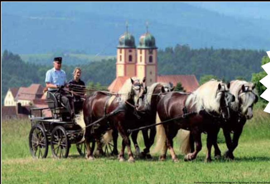
SCHWARZWÄLDER KALTBLUT KALENDER 2017

side Sheela H von Weshorns Harvel mit der Wertnote 8,60. Der vom Haupt- und Landgestüt Marbach vorgestellte dreijährige Hengst LVV Umberto (Altwürttemberger) legte die Prüfung erfolgreich mit der Wertnote 6,80 ab. Weber/Eiberger