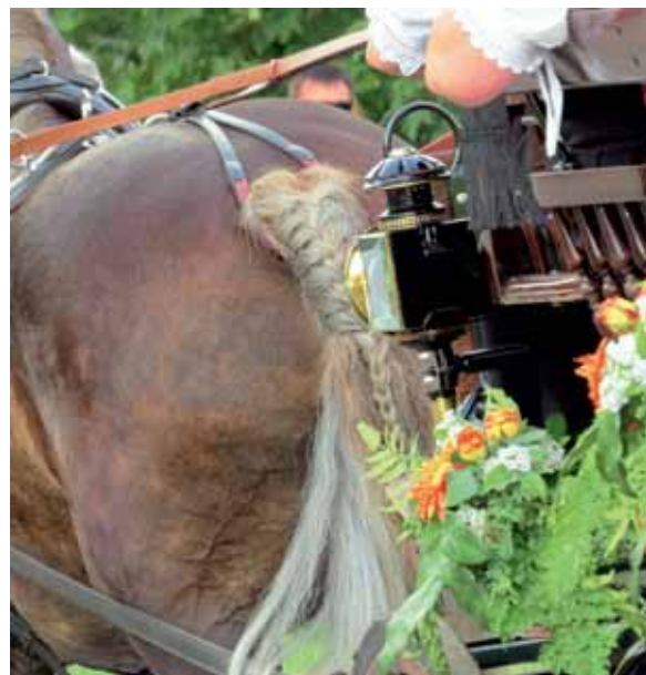
Impressionen vom Rossfest-Umzug in St. Märgen: der Sechsspänner vor dem Langholzwagen (o.), die „Wagnerei“ (l) und ein französischer Zopf (r.)