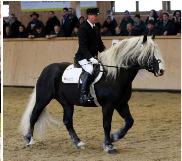
Pr LH Maitanz (geb. 2010) links, Foto HuL Marbach S. Kube, rechts Züchterttag 2018; Foto: G. Schröder.