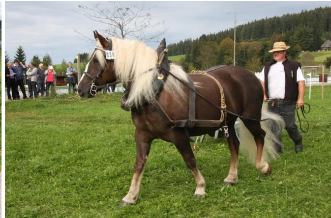
Links: StPr LSt Heide (geb. 2008), Stutbuchaufnahme 2011 in St. Märgen. Rechts: StPr LSt Maya (geb. 2009), Leistungsprüfung 2014 in St. Märgen, Fotos: Gerhard Schröder.