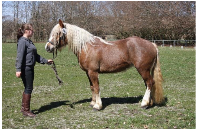
Links: LSt Gretel (geb. 2008), Leistungsprüfung 2017; Foto: Monique Müller. Rechts: LSt Modina (geb. 2009), Stutbuchaufnahme 2013 in Pfullendorf.