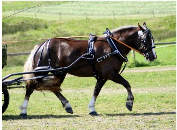
Links: Freya (geb. 2008) mit Hengstfohlen William, Fohlenschau 2016; Foto: Wolf Brodauf. Rechts: Alisa (geb. 2008), Leistungsprüfung St. Märgen 2011; Foto: G. Schröder.