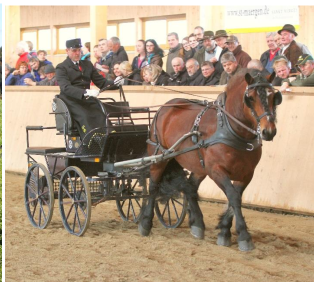
JHP LH Mondeo (geb. 2011) links Körung 2013, rechts Züchterttag 2018; Fotos G. Schröder.