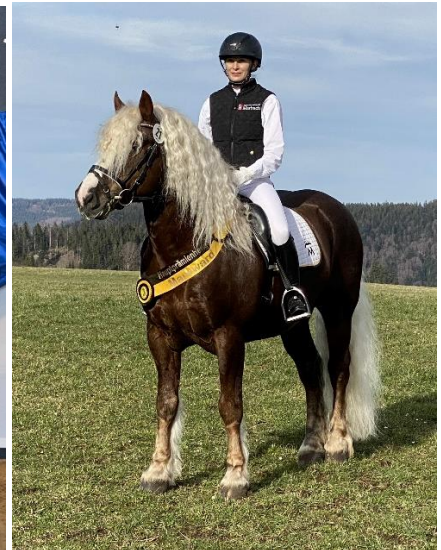
BP E LH Markward (geb.2009) links Bundeskaltblutschau München-Riem 2022; rechts Züchterttag 2023.