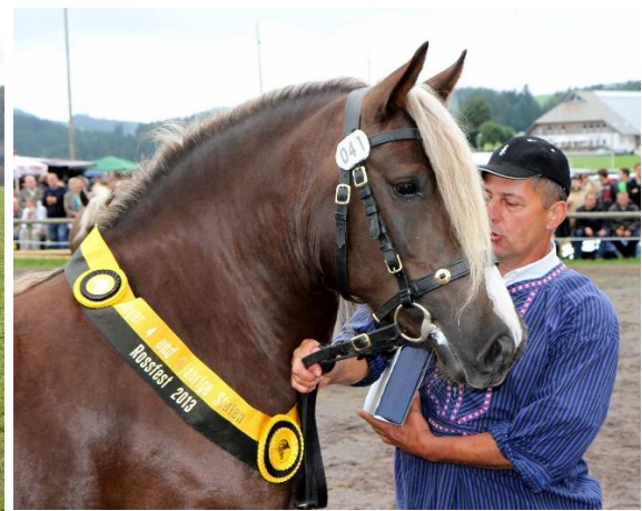
Links: StPr LSt Franziska (geb. 2009), Stutbuchaufnahme 2012 in St. Märgen. Rechts: Als Siegerin am Rossfest 2013; Fotos: Gerhard Schröder.