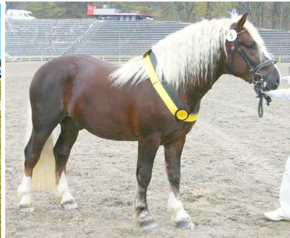
Links: Fohlen Modem von Modus mit Mutter StPrSt Dorle von Respekt, Fohlenschau Zöbingen 2003. Rechts: LVV Modem an der Körung 2005 in Marbach; Fotos: Gerhard Schröder.