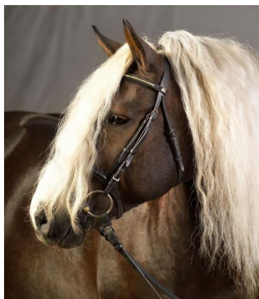
LVV Modem von Modus; Fotos: HuL Marbach.