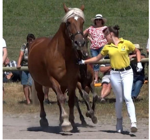
Links: VPrSt Dorin (geb.2009) mit Hengstfohlen von Drachenfels, Fohlenschau 2023 in Willich im Rheinland; Foto: Michaela Mertz. Rechts: LSt Silva (geb, 2008), Fohlenschau 2020 St. Märgen; Foto: Elke Rosewich.