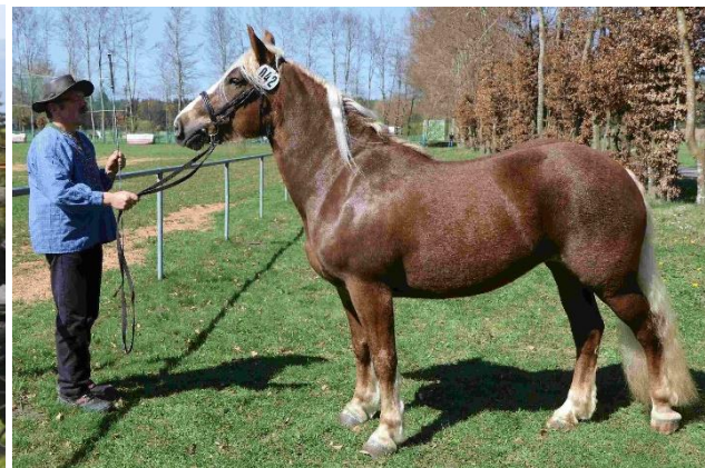
Links: StPr LSt Fiona (geb. 2011), Leistungsprüfung 2014 in St. Märgen; Foto: Gerhard Schröder. Rechts: StPr LSt Marisa (geb. 2014), Stutbuchaufnahme 2017 in Pfullendorf.